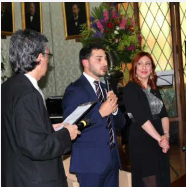
Un momento della premiazione