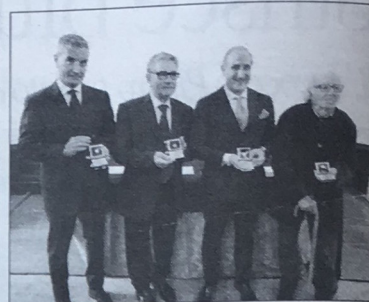
In alto le personalità premiate con il "Carlino d'argento". Sotto la sala concerti e i musicisti che si sono esibiti durante la cerimonia