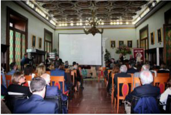
Il pubblico in sala