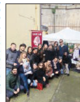
I ragazzi del Leo Club

Lo Street Store è diventato un appuntamento importante per la comunità Catanzarese, che già