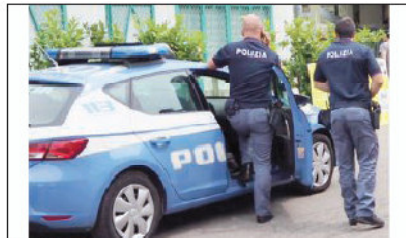
Agenti della Polizia di Stato

L'aggravamento scaturisce dal controllo effettuato dalla Squadra Volante lo scorso 29 ottobre quando l'uomo, che si trovava sottoposto agli arresti domiciliari, veniva sorpreso in possesso di circa