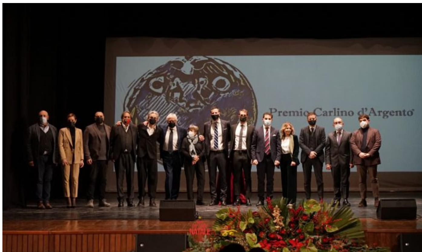
CARLINO D'ARGENTO 2021 - MOMENTO FINALE