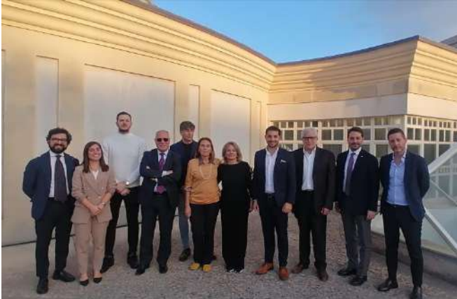
La Commissione del Premio Carlino d'Argento

La cerimonia avrà luogo il 9 dicembre al Teatro Politeama