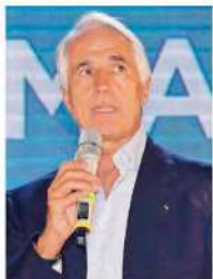
Riconoscimenti L'Um g conferirà la laurea a Giovanni Malagò e Luca Pancalli

Al termine, il rettore conferirà le lauree magistrali in Scienze e Tecniche dello sport e della Attività motorie preventive ed adattate a Giovanni Malagò e Luca Pancalli.