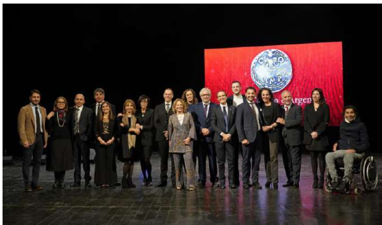
Premio Carlino d'Argento