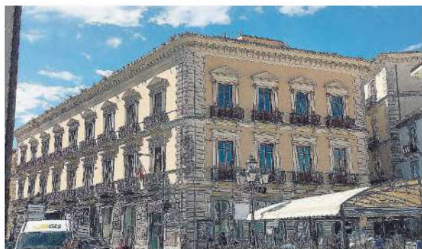
Sede storica Il Palazzo che ospita la Camera di commercio si trova in pieno centro città

L'Ente unico tra Catanzaro, Crotona e Vibo Valentia